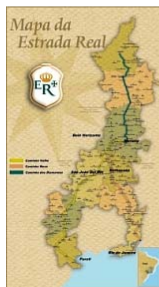
Mapa da Estrada Real - Clique para vê-lo ampliado

Margeando o Caminho Novo situava-se o sertão para a parte do Leste, denominados Áreas Proibidas e, assim conhecidas, por servirem de barreira natural ao contrabando do ouro.