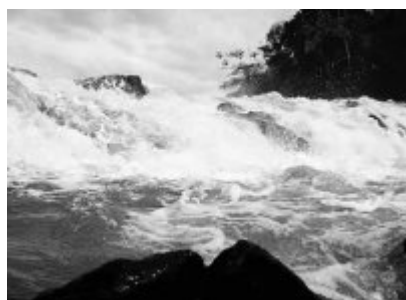
Cataratas do Rio Pomba

Até a década de 30 dos 1700, o ouro foi abundante nos núcleos mineradores do alto Rio Doce; conheceram ligeiro declínio na década dos 40, decaindo francamente a partir de 1763. No início do Séc. XVIII, afrouxando - se a política protetora sobre as Áreas Proibidas, iniciou-se a catequese.